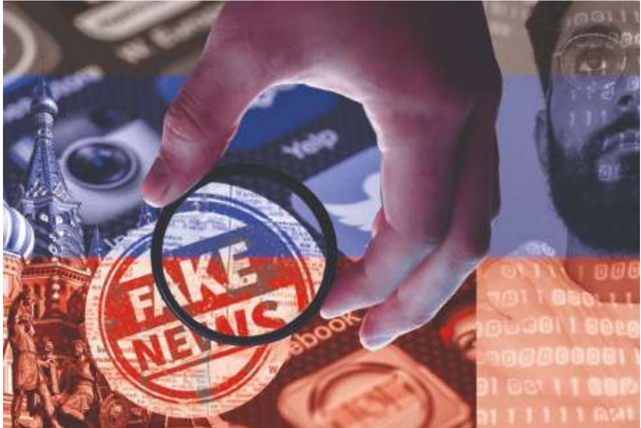
Propaganda y desinformación rusas